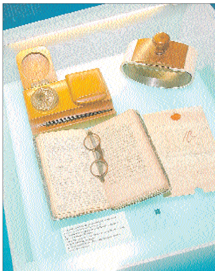
Dem Privatmann Schneider auf der Spur: Tagebuch und ein Liebesbrief des Politikers und Arztes.

Das Schlossmuseum Nidau wird morgen mit einem Festakt eröffnet. Es ist von Montag bis Freitag, von 8 bis 18 Uhr, geöffnet.