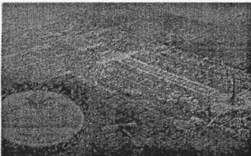
1913 entstand der Plan, zwischen Murten- und Neuenburgersee eine Weltstadt zu bauen (unten links). 1625 sollte am Ufer des Neuenburgersees eine europäische Handelsstadt entstehen. 1970 wehrten sich die Seeländer Gemeinden gegen einen Flughafen im Grossen Moos.

Stellen entgegen und wehrte sich gegen die Verschandelung der Natur. Die Ausstellung in Nidau zeigt nicht nur Pläne und Beschrreibungen, sondern auch Ausschnitte aus der Filmwochenschau oder der Tages-