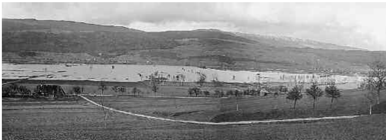
Überschwemmung 25. Nov. 1944, Blick vom Jolimont gegen Le Landeron. Inondations du 25.11.1944, vue du Jolimont vers Le Landeron.

Avant les premières corrections des eaux du Jura (CEJ), les terrains entourant la ville étaient surtout utilisés comme pâturages et prairies à foin. L'élevage jouait un rôle important durant cette période: jusqu'à la Deuxième Guerre mondiale, les gens élevaient encore des douzaines de vaches dans la vieille ville. L'agriculture n'était possible qu'en